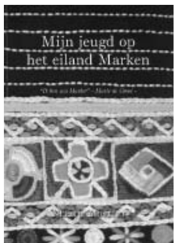
Omslag van het boek.