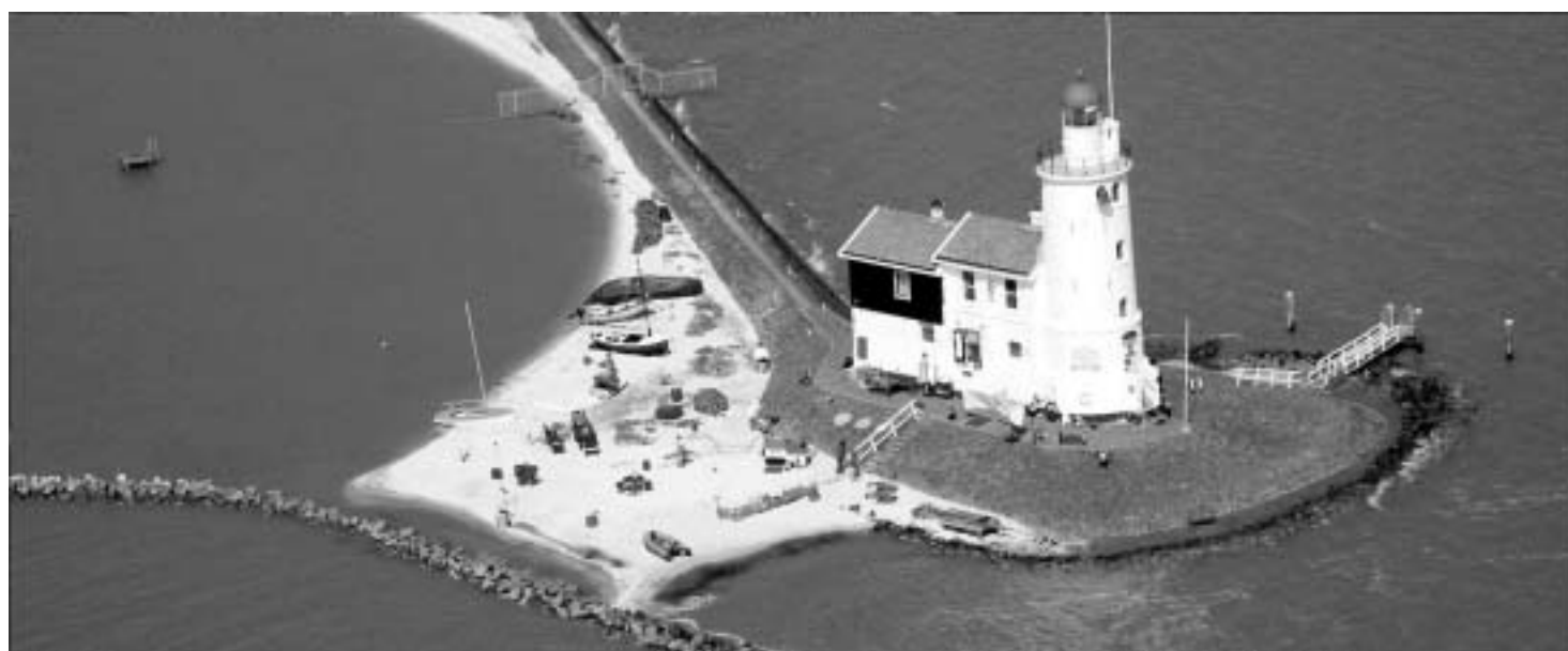
Het Paard van Marken, baken voor zeelui van toen en nu.