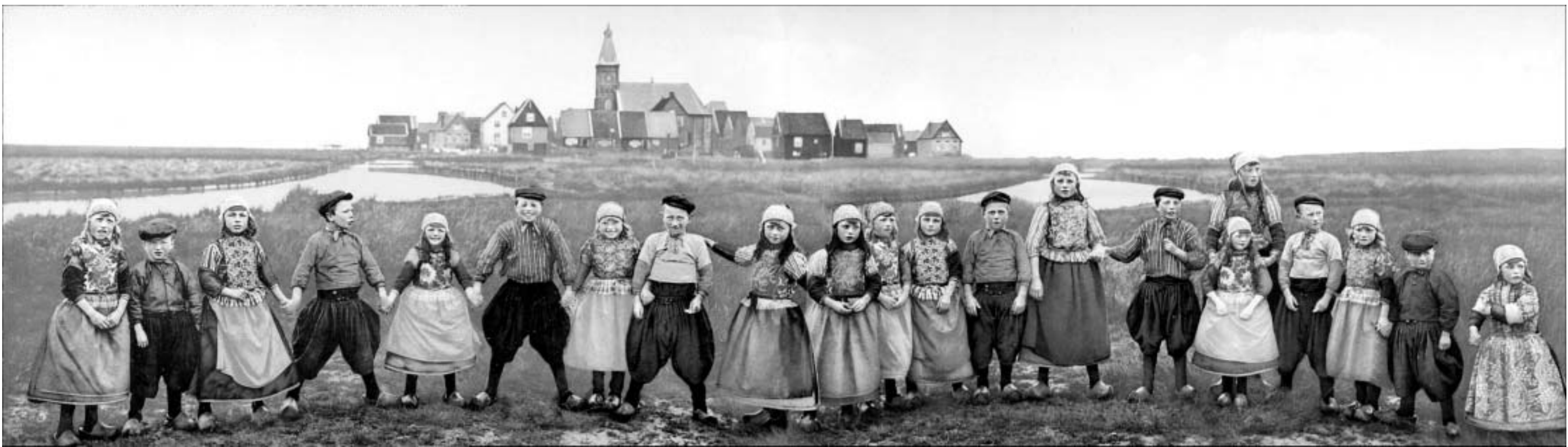
Een handgekleurde foto van een groep Marker kinderen in het begin van de vorige eeuw.